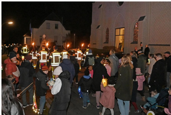
Foto: Martinsumzug St. Marien am 11.11.2025

Zahlreiche Teilnehmer des Martinsumzuges verweilten nach dem Umzug auf der Pfarrwiese und kamen miteinander ins Gespräch. Der Kindergarten sorgte für Getränke und Imbiss.